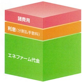
その他の金融機関